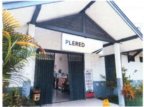
PINTU MASUK STASIUN