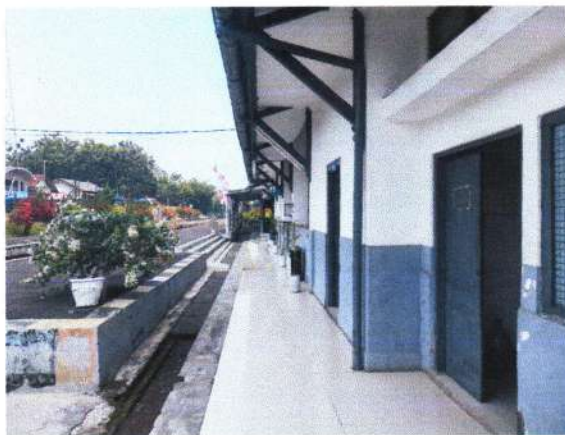
TERAS BAGIAN BELAKANG