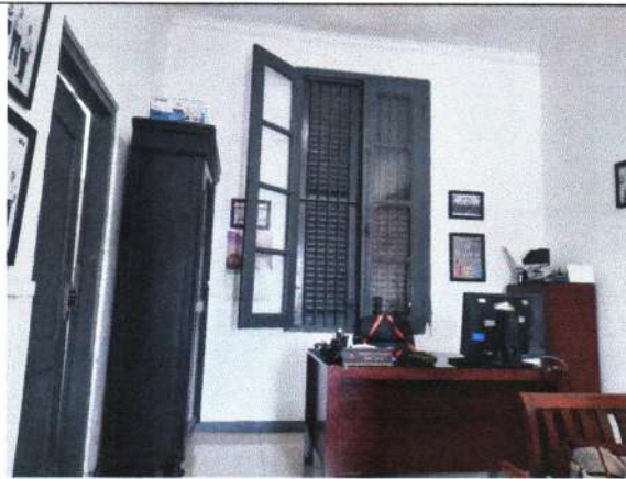
JENDELA ASLI MASIH TERPASANG DI RUANG KS