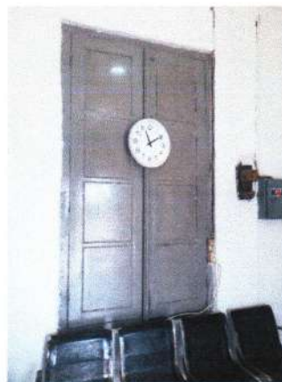
KUSEN ASLI DI RUANG STAFF, SEBAGAI BATAS DINDING LUAR BANGUNAN