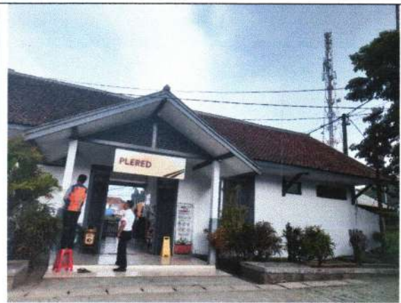
LETAK JENDELA RUANG KS PADA TAMPAK DEPAN