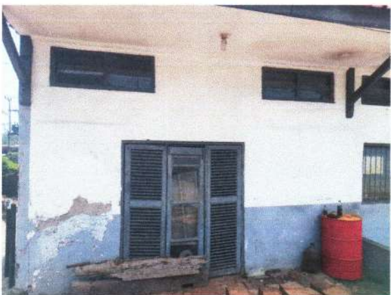
PINTU RUANG GUDANG YANG TERLIHAT SEPERTI PINTU KUSEN BARU