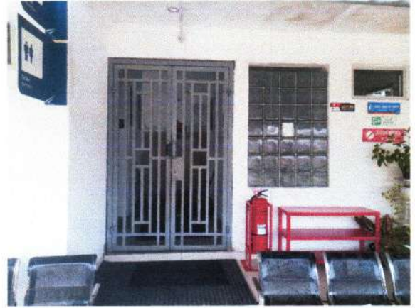
MUSHALLA DAN TOILET