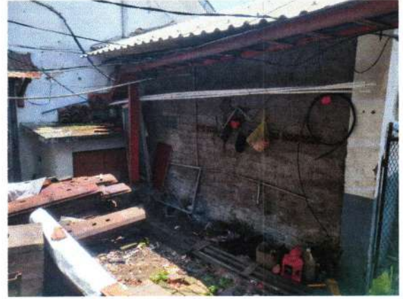
R BELAKANG PPKA