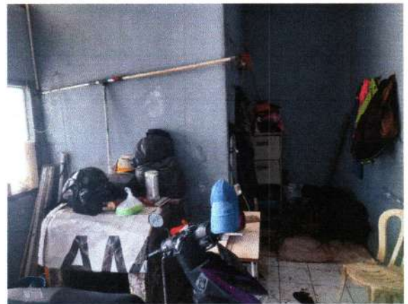
BAGIAN DALAM GUDANG PERUBAHAN