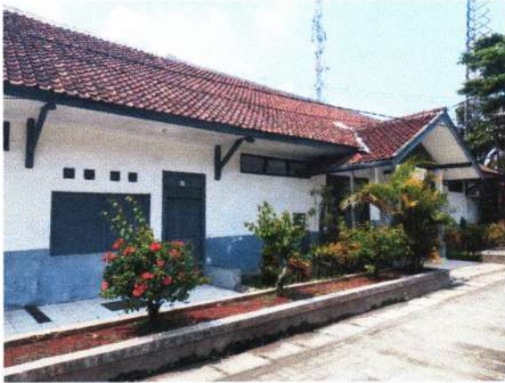
RUANG BAGIAN DEPAN STASIUN