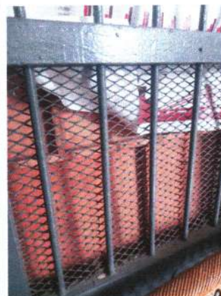
RAM JALUSI KUSEN YANG MASIH TERPASANG