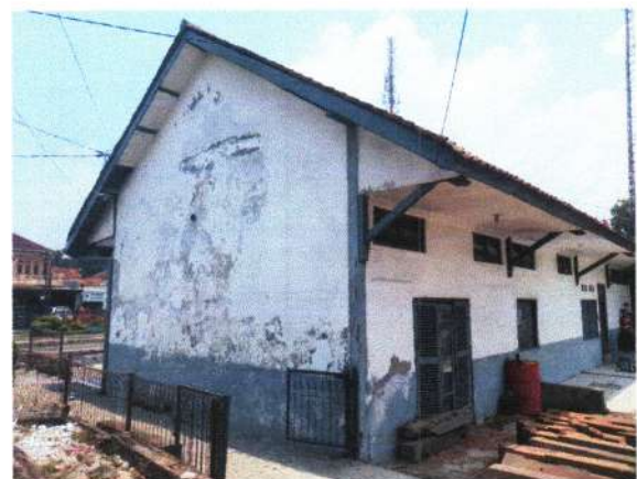
Tampak Sisi Utara