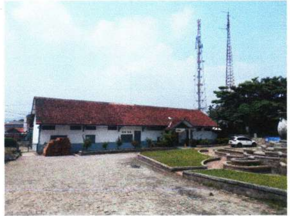
TAMPAK BAGIAN DEPAN DARI ARAH LUAR