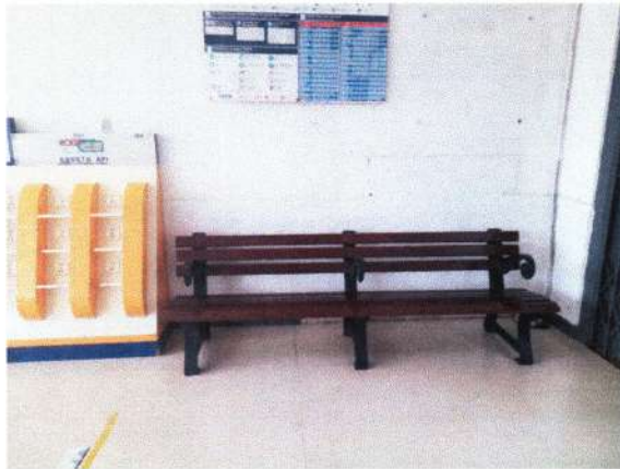
GRANIT 1 X 1 M DAN KURSI PANJANG ASLI