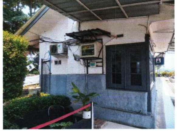
TAMPAK BAGIAN UTARA