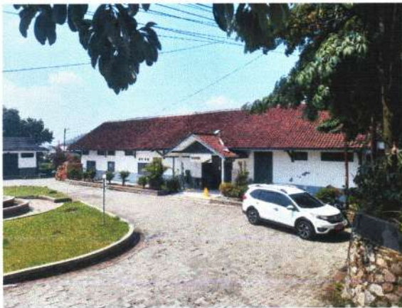
TAMPAK BARAT DEPAN STASIUN