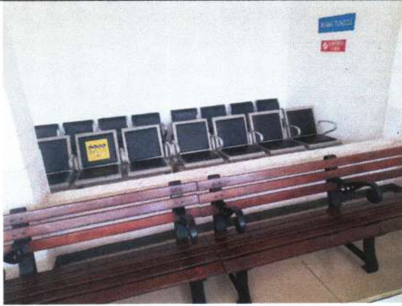
BANGKU YANG MASIH ADA