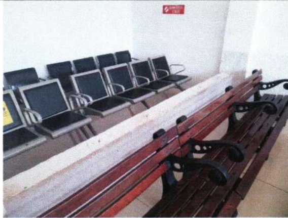
DINDING SEKAT BATAS LUAR BANGUNAN