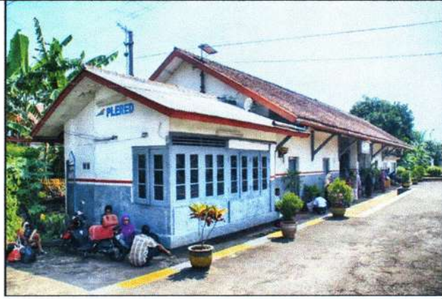
STASIUN PLERED DOKUMENTASI TAHUN TIDAK DIKETAHUI ( ARSIP GOOGLE)