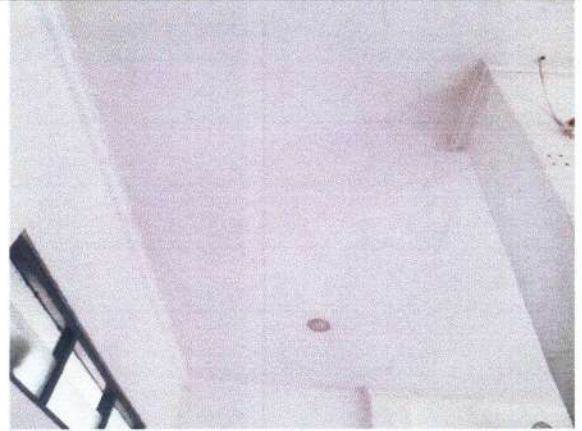
PLAFOND BARU GYPSUM