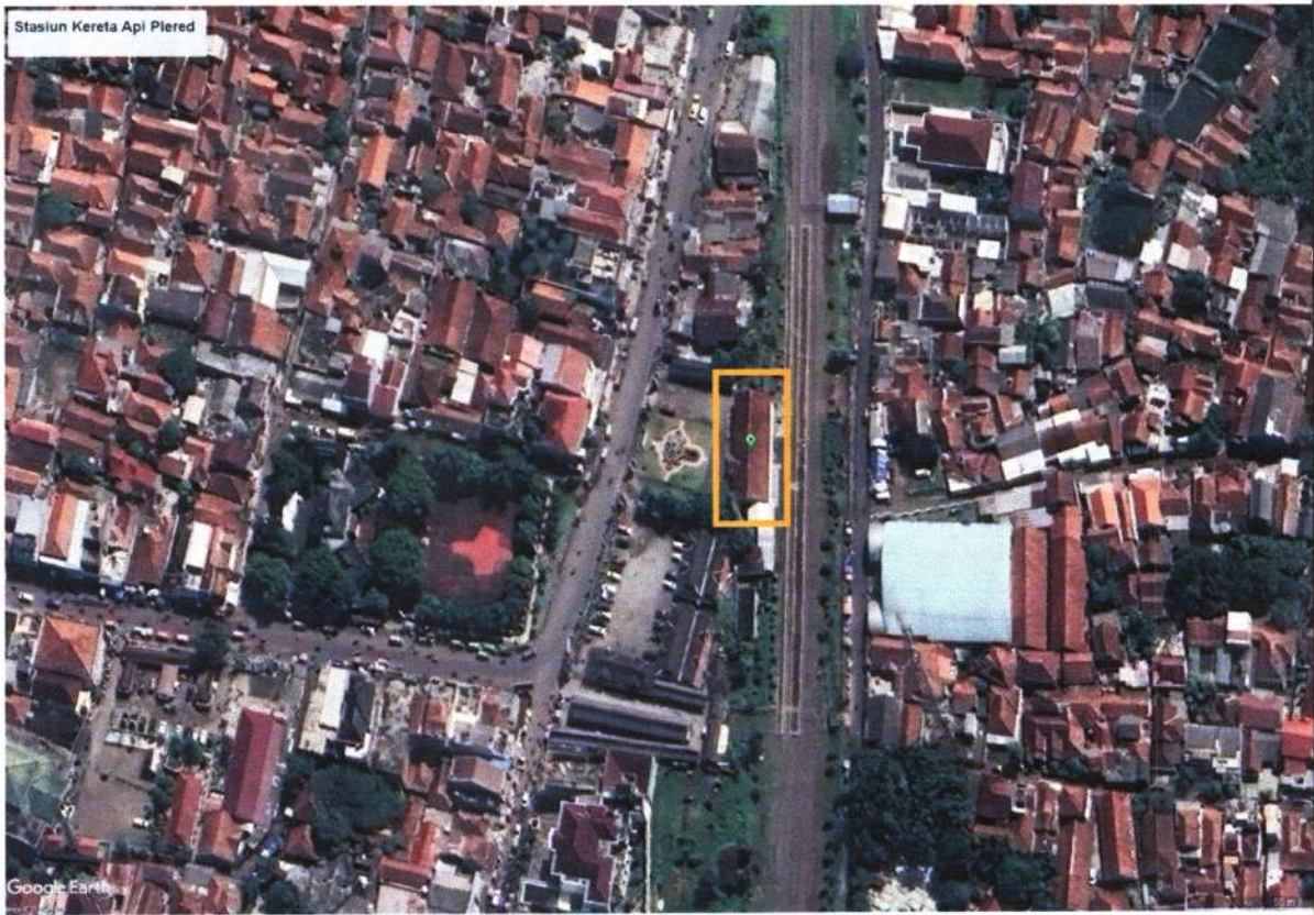
Lokasi ODCB Stasiun Kereta Api Plered