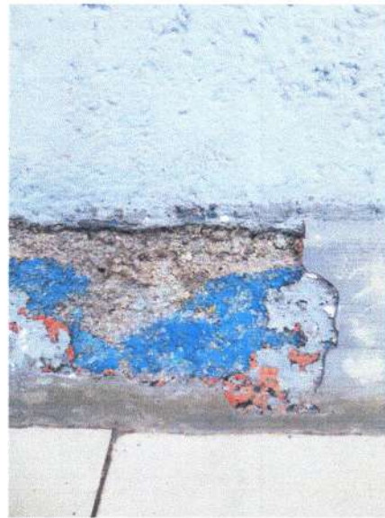
PERGANTIAN WARNA CAT DALAM BEBERAPA PERIODE