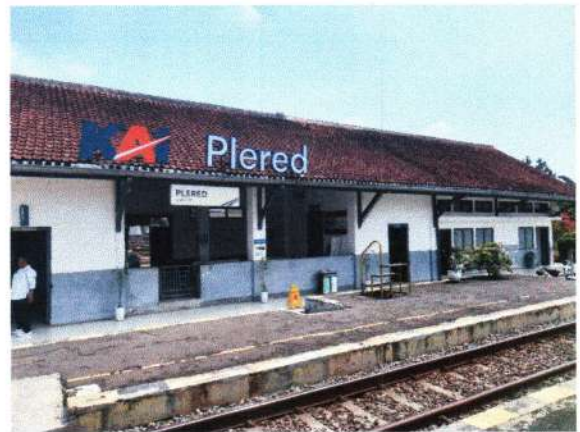
TAMPAK BELAKANG STASIUN