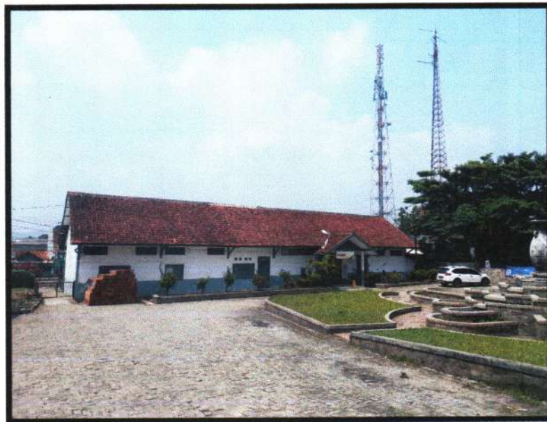
Stasiun Kereta Api Plered 2025