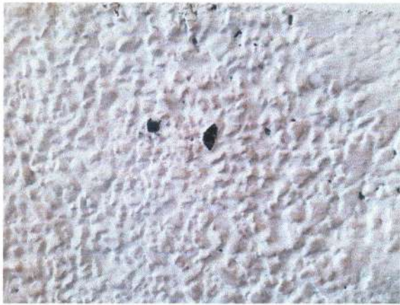
LAPISAN KAMPROT PECAH BELING YANG TERTUTUP LAPISAN CAT