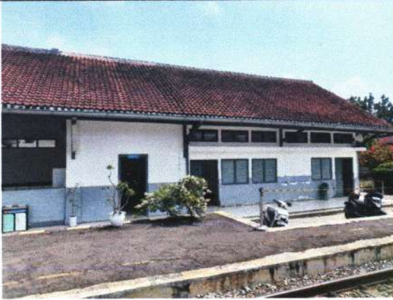
RUANG BAGIAN UTARA