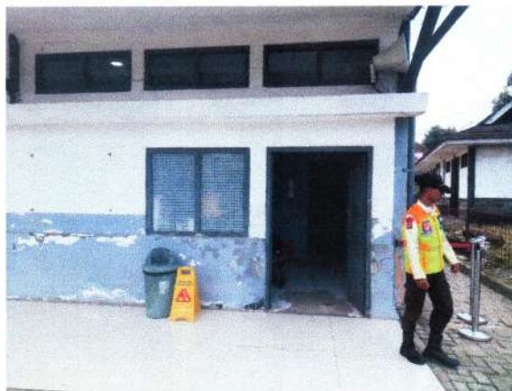
RUANG GUDANG DENGAN JENDELA BARU