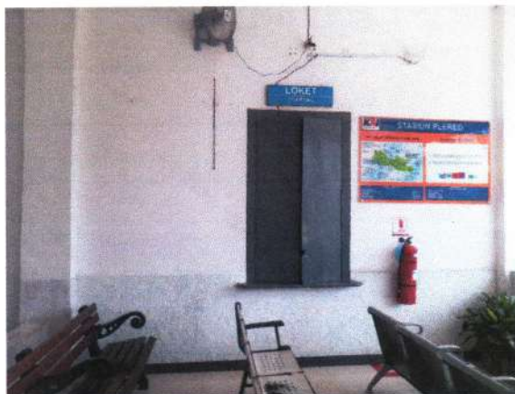
JENDELA LOKET YANG MASIH TERPASANG