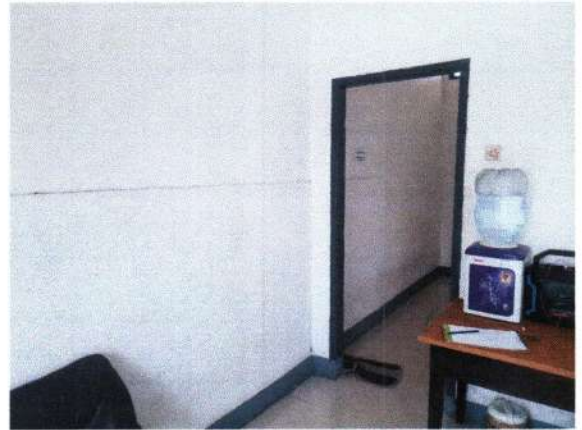
RUANG BARU YANG DI RUANG JJ