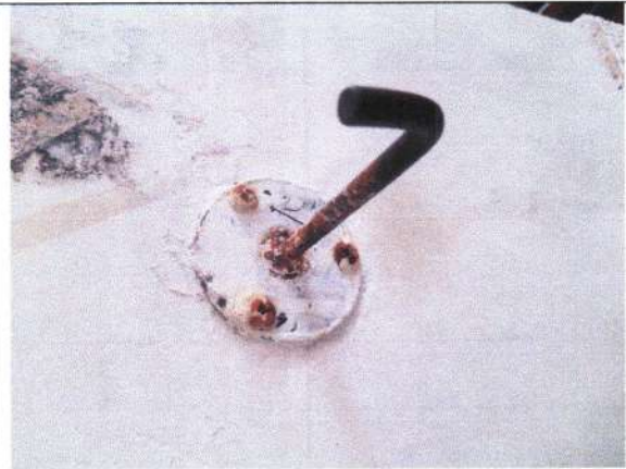
KAPSTOK MASIH ADA