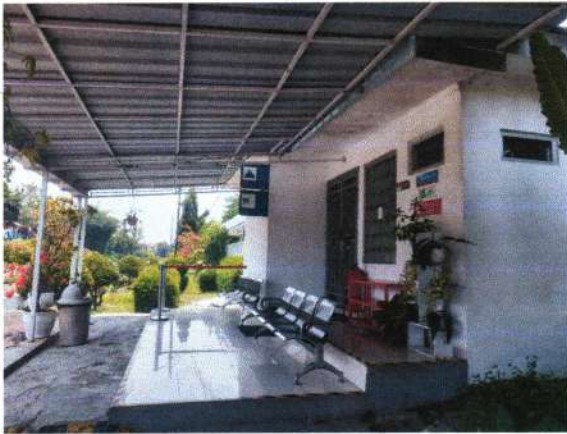
MUSHALLA DAN TOILET