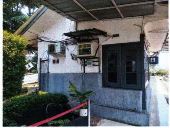
STASIUN PLERED 2025