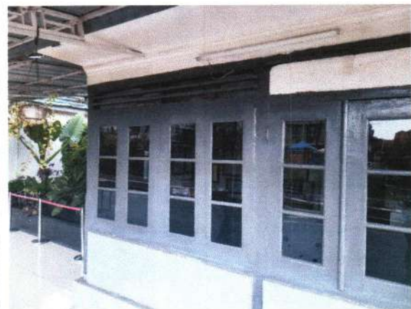
FASADE KLASIK RUANG PPKA